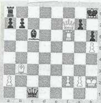
MAZE - ELBILIA

Partita giocata nel campionato a squadre francese 2011. Il Bianco ha dato matto giocando 1. Df8+, T:f8; 2. T:f8+, Rh7; 3. Ag8+, Rh8; 4. Af7+, Rh7; 5. Ag6 matto. Istruttivo. Se 1...Rh7; allora 2. Ag8+, con la medesima manovra di matto. Il campionato è stato vinto dalla squadra di Marsiglia che nell'ultima giornata ha sconfitto la squadra di Clichy scavalcandola in classifica. Terzo posto per la squadra di Evry, in cui militava Fabiano Caruana.